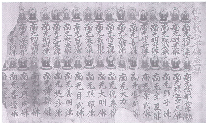
Gedeelte van de 'Duizend Boeddhas' van de Bhadra Kalpa. China, 3de, 4e of 5e eeuw.

‘Een eigen ritueel verzinnen is lastig. Bedenk maar eens iets anders voor buigen. Een handje schudden? In de kerk had je op een gegeven moment de vredeskus. Een soort hug die je aan je buurman doorgeeft. Zo kan het ook. Eigenlijk vind ik de rituelen die wij in de zendo doen wel wat hebben.’