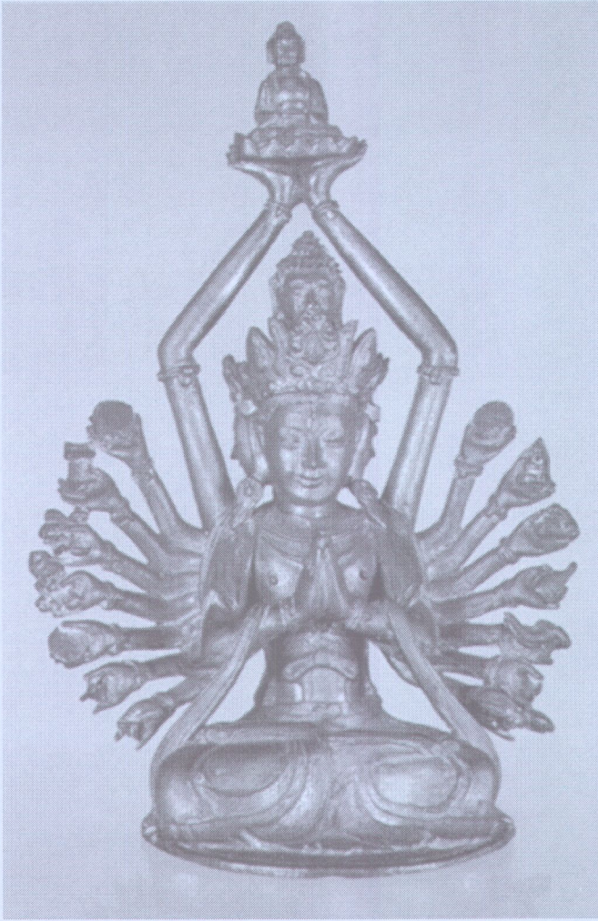
Bodhisattva Avalokiteshvara, brons, ±14e eeuw, China