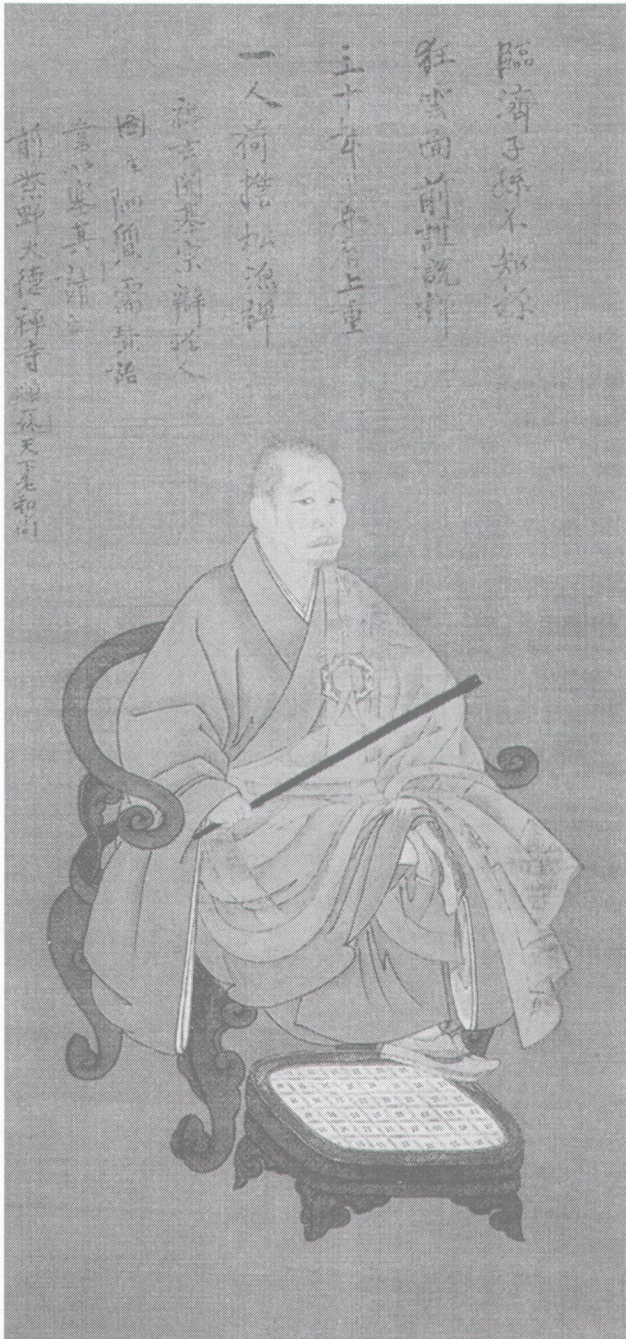
Ikkyū Sojun, 1394-1481