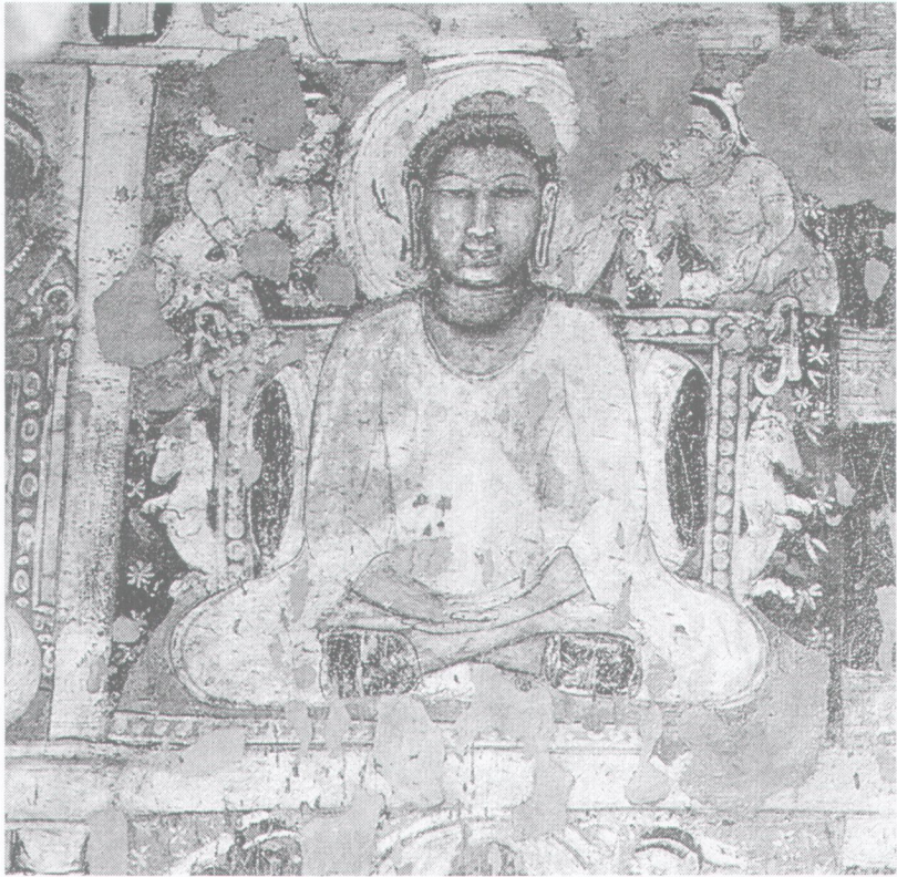
Boeddha in meditatie, grot 17, Ajanta, India

Dit heeft niets te maken met een of andere ‘spirituele’ inspanning die we verrichten: voor Dogen is zazen geen spirituele maar een somatische praktijk. Het gaat er niet zozeer om dat we een hoger geestelijk inzicht bereiken, maar dat we fysiologisch getransformeerd worden. 3