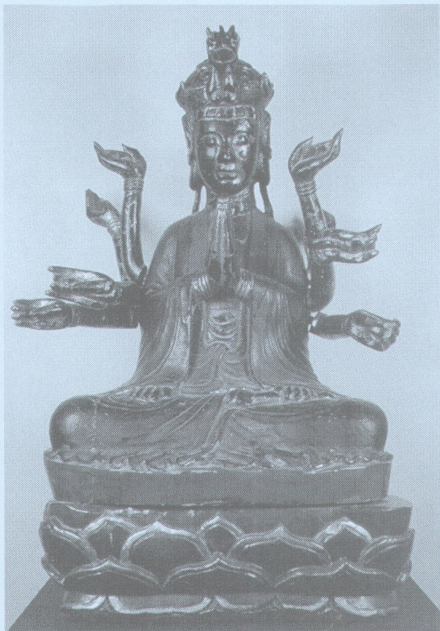
Bodhisattva Avalokiteshvara, hout, 18e eeuw, Vietnam